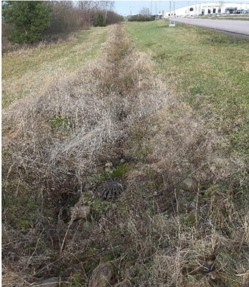
Gräsbevuxet svackdike utformat som ett infiltrationsstråk.

Viktiga delar att kontrollera vid svackdiken: