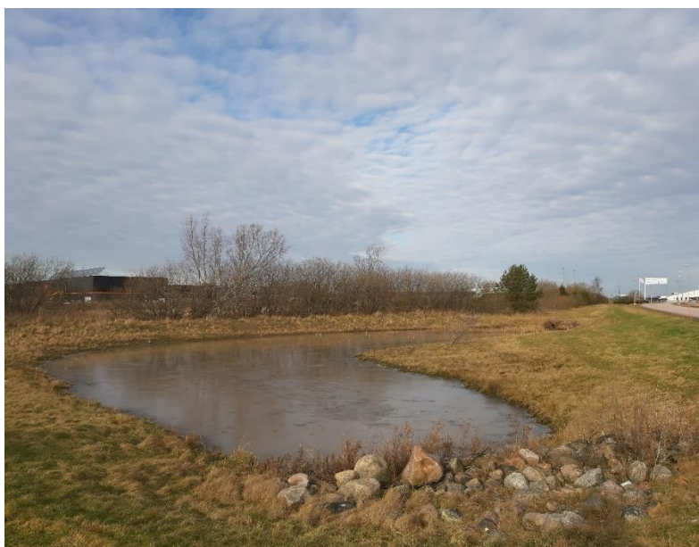
Dagvattendamm med stensatta in- och utlopp.

Både dagvattendammar och våtmarker kräver regelbunden inspektion och kontroll. Fokus bör ligga på inlopps-/utloppsstrukturer.