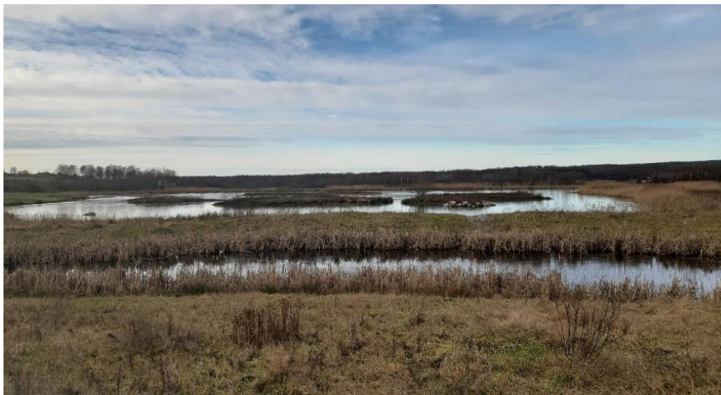
Våtmark med fördamm och stensatt bräddanvisning mellan vattenytorna (foto Gun Wallnedal Enghult).