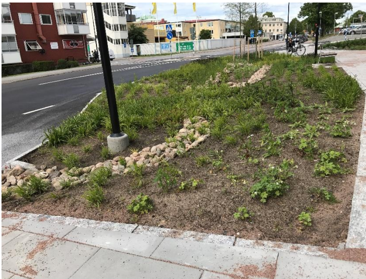
Biofilter i Lerums kommun.

Oftast dimensioneras anläggningarna till att klara regn med 1-2 års återkomsttid, därmed kan 90-95% av den totala årsnederbörden renas. Vid större regn bräddas vattnet eller leds förbi anläggningen. Det är viktigt att undersöka hur anläggningen klarar större regn för att det inte ska bli erosion i anläggningen. Placering av större stenar i inloppet kan vara ett sätt att få till ett erosionskydd. Den största reningen sker i filter-/jordmaterialet. Växterna bidrar i mindre grad till reningen, men upprätthåller bland annat infiltrationskapaciteten och minskar erosionen.