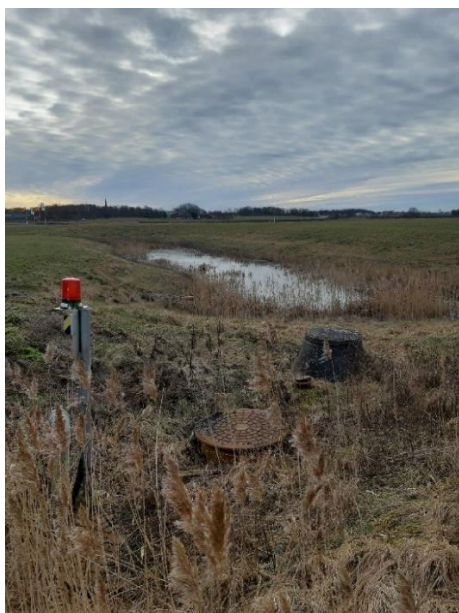
Dagvattendamm med oljeavskiljare innan utlopp i dike.